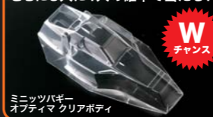
ミニッツバギー オフティマ クリアボディ