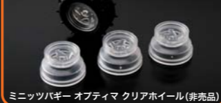
ミニッツバギー オフティマ クリアホイール(非売品)