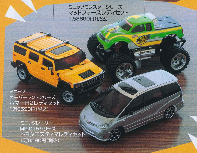
ミニッツモンスターシリーズ マッドフォースレディセット 1万8690円(税込)