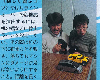
どこまで加速を続けるかの勝負の分かれ目を見極めよう!

【競技内容】場所はどこでもいので平面上に目標となるラインを決め、そのラインにどれだけ近づけるかを競う。 【ルール】2台以上で同時に行なうのが盛り上がりポイントでオススメ。ブレーキの使用を厳禁とし、フル加速後のスロットルオフでの惰性のみでラインに近づけることを徹底しよう。 【楽しく遊ぶコツ】やはりラインオーバーの危機感を演出するには、機の端などに停止ラインを設定したい。その際は機の下に布団などを敷き、落ちてダメージが及ばないようにすること。距離を長くすると難易度が飛躍的に上がるゾ!