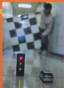
「スタートシグナル(3990円。税込み)」があると盛り上がるゾ

【楽しく遊ぶコツ】距離を伸ばすと最高速重視のクルマが有利になるだけ。参加車両の設定によって適切な距離を設定しよう。