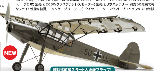
可動式前縁スラット&後縁フラップ!

京商R/C勢揃い!! BSフジにてR/C新番組 「RC STYLE 放映中!」 毎週木曜日22:00 - 22:30 (隔週更新) 放送/BSフジ