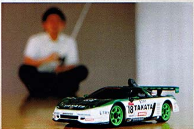
道上選手はミニッツを練習用として愛用しているほか、自宅玄関にオブジェとしても飾る。

1973年奈良県生まれ。スーパーGT選手権、全日本選手権フォーミュラ・ニッポンなど、最前線で活躍するレーシングドライバー。取材当日は惜しくもリタイアしてしまったルマン24時間から帰国した当日だった。